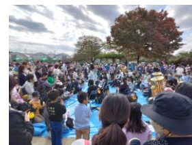
22年11月、多世代交流イベントを企画開催しました

地域活性化のため、多世代交流イベントの企画開催を継続します。楽しむことを通じて住民間で顔見知りも増え、平時も災害時も協力しあえる地域作りにつながります。